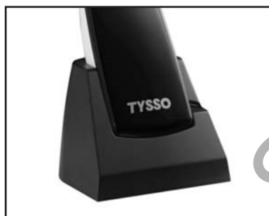
Culla ricarica e comunica