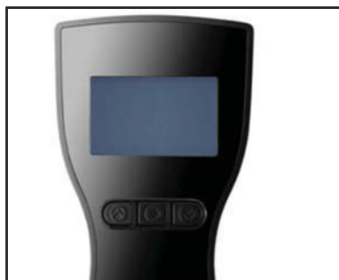
Tasti di navigazione