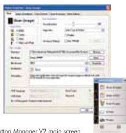
The Button Manager V2 main screen

Button Manager V2 facilita la scansione e l'invio delle immagini alle vostre destinazioni preferite con la sola pressione di un tasto. Con esso è possibile scansionare e caricare automaticamente i documenti su cloud repositories come Google Docs, Microsoft SharePoint, o FTP. In aggiunta è possibile trasferire le immagini scansionate o il testo riconosciuto da OCR (Optical Character Recognition) nelle vostre applicazioni di text editor come, ad es., Microsoft Word. Tutti i formati di output sono supportati, inclusi i formati PDF/1A e PDF/1B