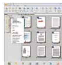
The PaperPort SE14 main screen

- La scelta professionale per organizzare e condividere i vostri documenti