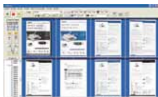
The AVScan X main screen

Il Document Imaging è il primo passo verso il Document Management. Tuttavia immagini di poca qualità possono in seguito creare problemi ai processi d'indicizzazione e memorizzazione, aumentando i costi di post-scansione. AVScan X garantisce che tutti i documenti siano controllati e puliti al momento della scansione così da essere perfetti per le elaborazioni successive. AVScan X è una soluzione intelligente di scansione e creazione immagini. AVScan X possiede diverse funzionalità che convertono e indicizzano le immagini scansionate in documenti elettronici per una ricerca semplice e veloce.